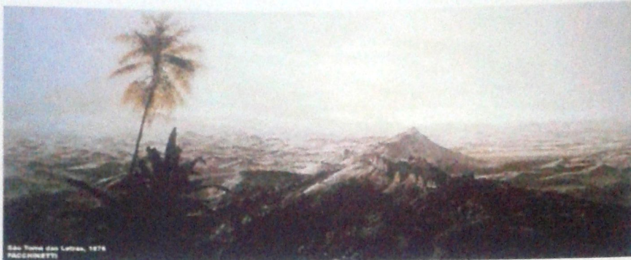
Nicolau Antonio Facchinetti. 1876 Acervo: Museu Nacional de Belas Artes do Rio de Janeiro